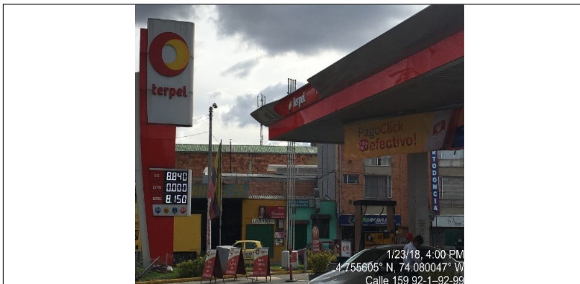
Fotografía No. 2 Vista panorámica del elemento tipo aviso en fachada de la estación de servicio Acapulco, ubicada en la Carrera 92 No. 158 – 65, el cual no cuenta con solicitud de registro ante la entidad.