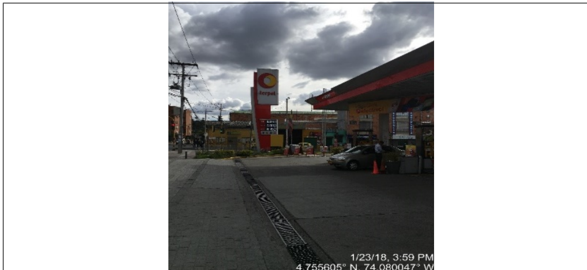
Fotografía No. 1 Vista panorámica del elemento tipo aviso separado de fachada de la estación de servicio Acapulco, ubicada en la Carrera 92 No. 158 – 65, el cual cuenta con solicitud de registro No. 2017ER182623 del 19/09/2017.