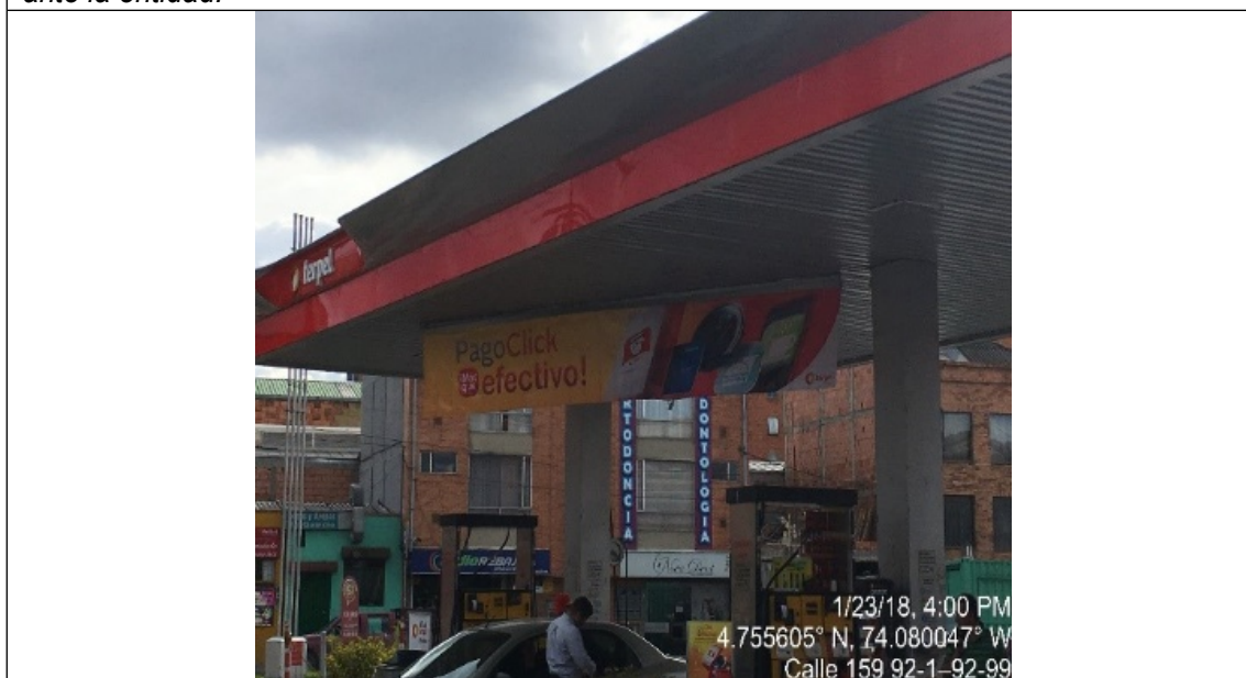
Fotografía No. 3 Vista panorámica del elemento tipo pendón de la estación de servicio Acapulco, ubicada en la Carrera 92 No. 158 – 65, el cual se encuentra publicitando información comercial del establecimiento.